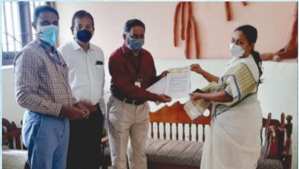
മുൻകാണിച്ച ആവശ്യങ്ങൾ ഉന്നയിച്ചുകൊണ്ടുള്ള നിവേദനം ആരോഗ്യവകുപ്പ് മന്ത്രി വീണ ജോർജിന് നൽകുന്നു.

മാർക്കും മന്ത്രിമാർക്കും നിവേദനങ്ങൾ നൽകുകയും ചെയ്തിട്ടുണ്ട്. പ്രത്യേകിച്ച് പ്രതിപക്ഷ നേതാവ് ശ്രീ.വി.ഡി.സതീശനെ നേരിട്ട് കണ്ട് നമ്മുടെ ആശങ്കകൾ അറിയിക്കുകയുണ്ടായി. ഇക്കാര്യത്തിൽ കോവിഡ് 19ന്റെ പരിമിതികൾക്കുള്ളിൽ നിന്നുകൊണ്ട് സംഘടന ഒറ്റക്കെട്ടായി എണ്ണിയിട്ട യന്ത്രംപോലെ പ്രവർത്തിച്ചു എന്നതിൽ നമുക്ക് അഭിമാനിക്കാം. തുടർന്നും ഈ പ്രവർത്തനങ്ങൾ ശക്തമായി മുന്നോട്ട് കൊണ്ടുപോകുവാനും നമ്മുടെ ലക്ഷ്യങ്ങൾ നേടിയെടുക്കാനും സംഘടന പ്രതിജ്ഞാബദ്ധമാണ്.