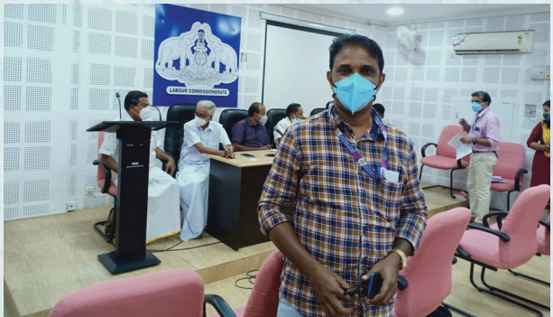
തിരുവനന്തപുരത്ത് മിനിമംവേതന ഉപദേശസമിതിക്ക് മുൻപാകെ തെളിവെടുപ്പിൽ സംസ്ഥാന ജനറൽ സെക്രട്ടറി സംഘടനയെ പ്രതിനിധീകരിച്ചു പങ്കെടുത്തു.